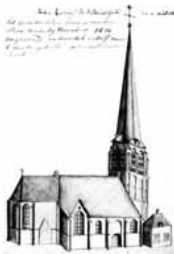
Op 9 oktober 1782 tekende Hendrik Verhees de kerk van Sint-Michielsgestel. Het gebouwde rechtsonder is het toenmalige raadhuis.

Na de reformatie veranderde dat totaal. Zorgen voor het heil van de overledenen was niet mogelijk; het was zelfs twijfelachtig of een levende daar iets aan kon doen. Een kerk die bemiddelde tussen hemel en aarde was er ook niet meer. Voor de gereformeerden was niet meer de kerk verantwoordelijk voor het eeuwige heil, maar de mens zelf. De rol van het kerkgebouw en de begraafplaats veranderde daarmee radicaal. De reformatie begon met het aanpassen van het kerkgebouw aan deze nieuwe verhouding. Al de 'heilige en gewijde' zaken werden uit de kerk verwijderd: altaren, heiligenbeelden, kruisen etc. Het kerkgebouw werd een kale ruimte, alleen geschikt om "bijeen te komen" en om te vergaderen.