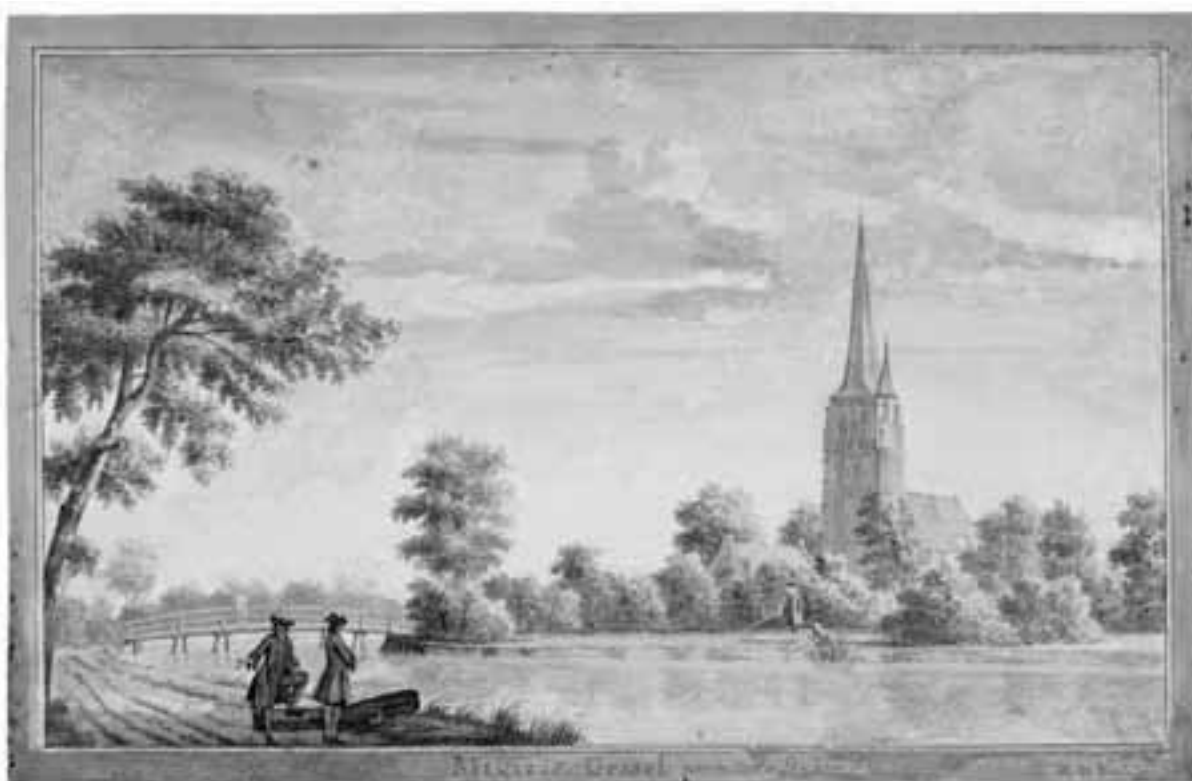
Zo zag de kerk van Sint-Michiëlsgestel er uit toen Job de Lange haar in het begin van de 18 e eeuw bezocht. (Prent van H. de Winter; Brabant Collectie, Bibliotheek Universiteit van Tilburg)