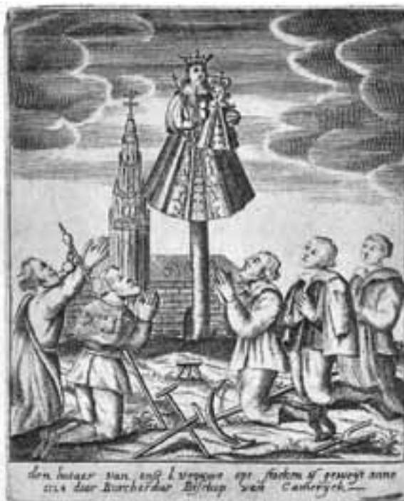
Verering van Onze-Lieve-Vrouw op 't Stokske. Kopergravure. (Antwerpen, UFSIA, Centrale Bibliotheek: Kathedraalarchief)

De verering van Onze Lieve Vrouwe is al oud. De verering van O.L.Vrouw op 't Stokske in Antwerpen nam vanaf 1474 een aanvang 16 . Ook O.L. Vrouw op 't Stokske in Vlissingen was een bedevaartsplaats 17 . In onze regio had de verering al eerder haar hoogtepunt. Het Bossche beeld van de Zoete Moeder dateert uit de periode 1280-1330. Haar verering nam een aanvang, toen het op Goede Vrijdag 1380 op het St. Michielaltaar in de St. Janskerk werd geplaatst en moet al snel veel belangstelling hebben getrokken. De auteurs van het boek over de mirakelen van de Zoete Moeder spreken van een explosie van wonderen in de periode 1383-1384. In november 1381 vond de eerste bedevaart plaats door een inwoner uit Dendermonde. In de periode 1430-1445 gingen de meeste bedevaarten die aan inwoners van Antwerpen werden opgedragen naar 's-Hertogenbosch 18 .