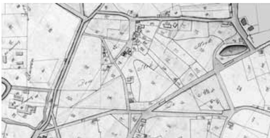
De Stokhoek op de kadastrale kaart uit 1832. Bovenin de huidige Duifhuisstraat, in de rechter bovenhoek het Duifhuis.

Toch kan de Stokhoek veel ouder zijn. Het is namelijk niet ondenkbaar dat het buurtschap zich ontwikkelde uit een oude boerderij. Dat de Stokhoek ouder is dan 1706 is wel enigszins aannemelijk te maken. In de Stokhoek lag de in de vorige aflevering van De Heertgang besproken boerderij met het Duifhuis en het bijliggend