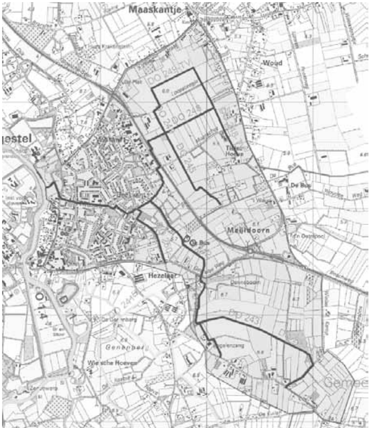
De waterloop die op de Kleine Ruwenberg in de Dommel stroomt, ontspringt in de Vogelenzang tussen Gestel en Schijndel. De Woudseweg en de Zandstraat liggen op een hoge zandrug (een oude route van Schijndel via Den Dungen naar Den Bosch) en vormen een zogeheten waterscheiding. Het water links van de lijn Woudseweg-Zandstraat stroomt naar de Dommel, het water rechts van die lijn naar de Aa.