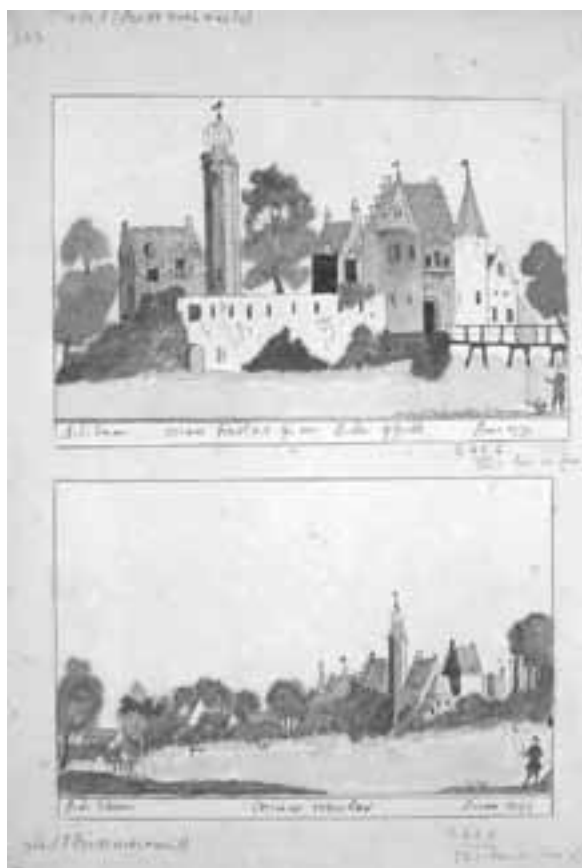
Deze twee schetsen van Nieuw Herlaer in 1732, uit de Atlas van Schoemaker zijn te vinden op de website hetgeheugenvannederland

De website geeft ook toegang tot 90 instellingen, die materiaal beschikbaar hebben gesteld. Op een gemakkelijke manier kom je zo op websites van vele archieven en musea terecht. Ook daar kun je weer heerlijk rondstruinen, op zoek naar talloze mooie en interessante zaken die in ons land bewaard worden. Je kunt zomaar 87.786 foto's van het Algemeen Nederlands Persbureau bekijken of 4.733 foto's uit het Nederlands Fotomuseum. Geïnteresseerd in de douane, in geld of het erfgoed van de oorlog? Het is allemaal te vinden. Vergeet niet je huisgenoten vaarwel te zeggen en een boterham mee te nemen naar je computer voordat je begint.