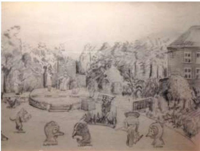
Van den Vos Reijnaerde Beekvliet Pinkster 1943

Pol de Monts Reinaert de Vos. Volksspel. Dramatische bewerking van het oude dierenverhaal uit 1925 was vermoedelijk al aanwezig in de bibliotheek van het seminarie, anders kan men het meegebracht hebben. De gijzelaars werden daarin redelijk vrij gelaten. Alleen Engelse boeken werden verwijderd, evenals Engelse grammofoonplaten. De tekst van dit toneelstuk is niet al te gevaarlijk. De inhoud op zich is natuurlijk wel 'brandstof' in een onvrije omgeving waar men onder gezag van de Duitse bezetter moest (over) leven. Enkele clausen in het stuk zullen zeker weggelaten, dan wel aangepast zijn. Een opvallende 'aanpassing' is in de lijst van dramatis personae te vinden. Bij Pol de Mont komen geen kippen en apen op de speellijst voor. Deze (zes) spelers zijn wellicht opgevoerd om meer personen te kunnen laten meespelen en om de toneelruimte, – het ging immers om openluchttheater –, beter te vullen. Op de bewaard gebleven tekening is een aap prominent afgebeeld. Een aap spreekt Reinaert toe, die op het punt staat als pelgrim, met tas, schoenen en staf te vertrekken. De galg, – hoe wrang in deze entourage –, is de vos ontlopen en staat doelloos links afgebeeld. Rechts is overigens een wachthuisje afgebeeld; er was altijd toezicht door de kampleiding.