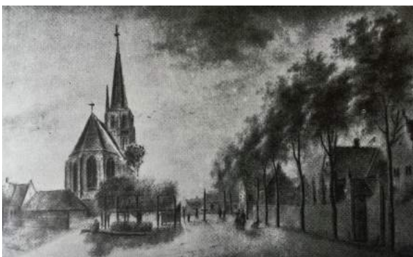
Dorpsplein rond 1760 met kerk en school en schoolhuis (links). De dorpslinde (midden) en rechts daarvan de schutsboom van de gilde.

Bron: Kroniek van St. Michiels Gestel door S.H.M. Jongmans 1963.